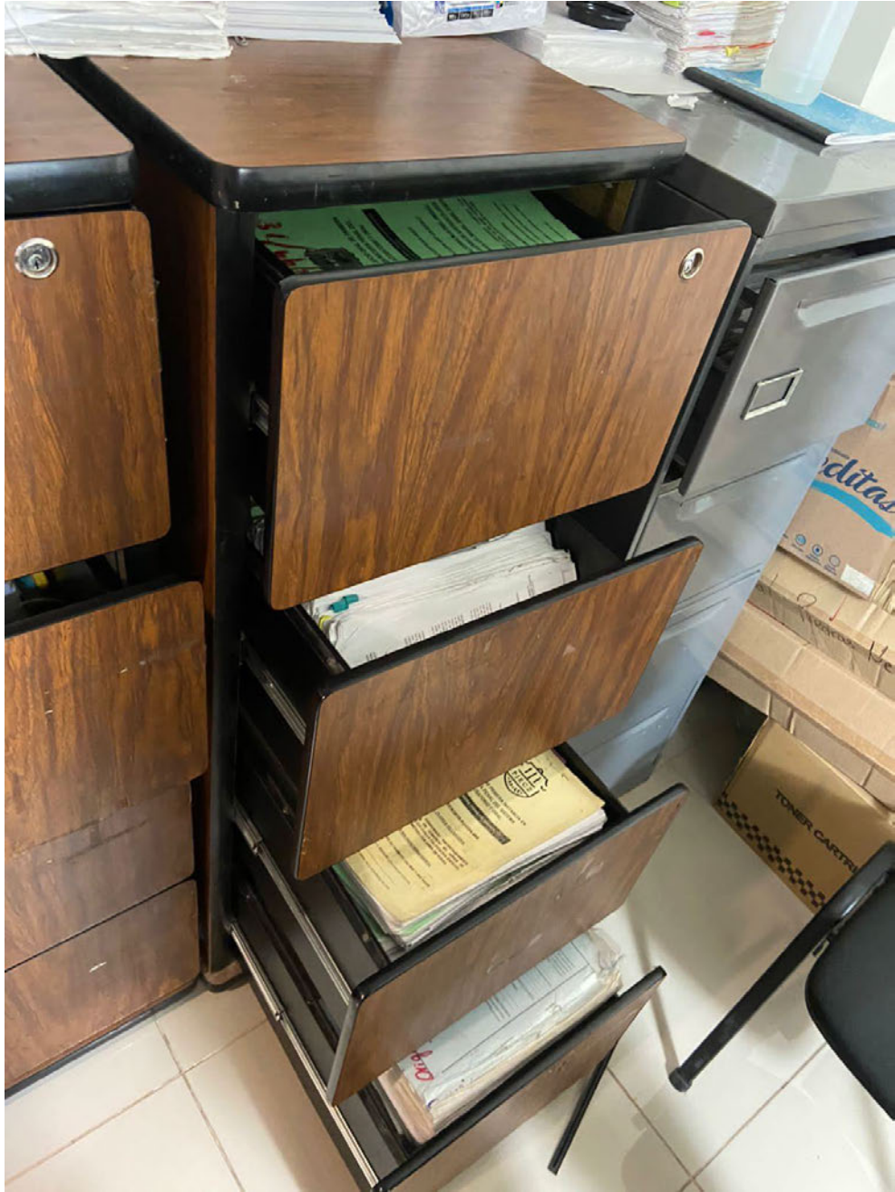
Archivero que contiene Carpetas de Juicio, original y duplicado, de expedientes provenientes del Juzgado Tradicional.